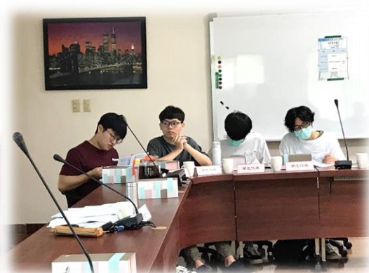
▲ 諮詢委員 與 本系學生代表 列席交流討論 ▲